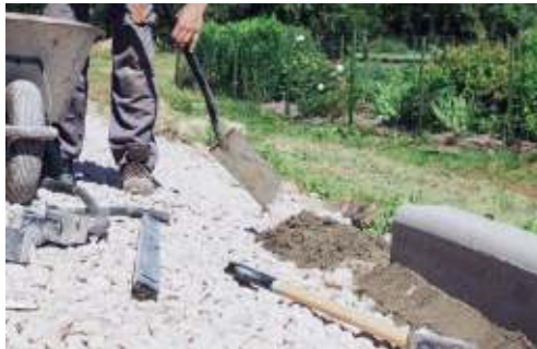
Randsteine, Palisaden setzen

Frischbeton passend für Ihr Projekt einsetzen