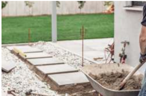
Platten und Pflaster verlegen