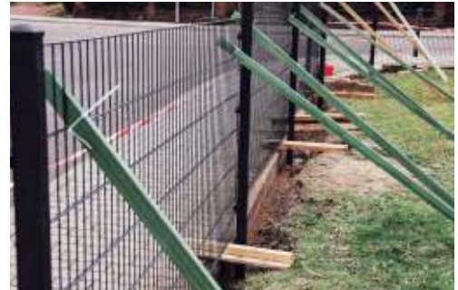
Leichte Fundamente errichten

Der Frischbeton ist für unbewehrte, nicht-konstruktive Baumaßnahmen im Garten- & Landschaftsbau, Straßen- & Tiefbau geeignet. Typische Anwendungen sind das Setzen von Randsteinen und Palisaden, Pflasterarbeiten, leichte Fundamente für Zaun-, Sichtschutz und vieles mehr.